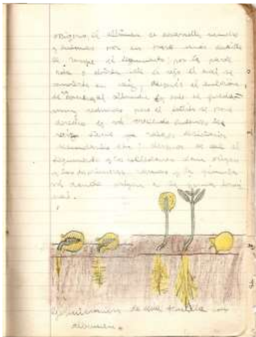
Ilustración 2. Cuaderno de Botánica, detalle