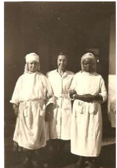
Ilustración 9. En el consultorio de Puericultura, Alcazarquivir (Marruecos)