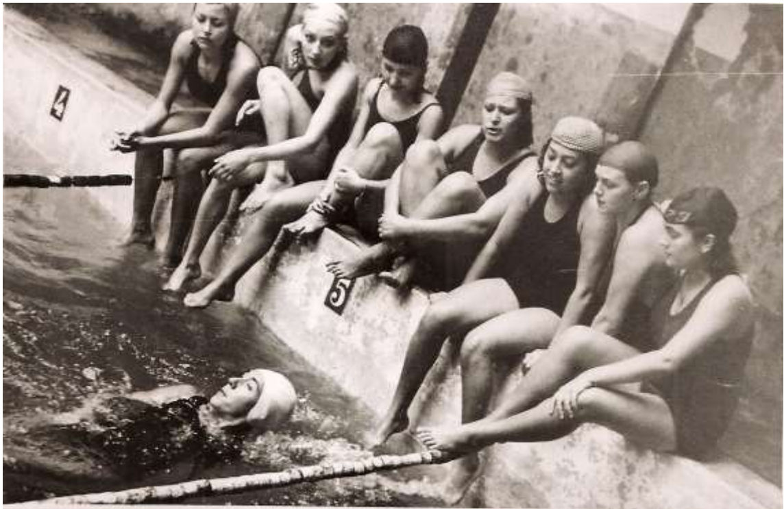
Ilustración 7. Impartiendo clases de natación.

¡donde las gélidas aguas de deshielo predisponen a un “paraván”!