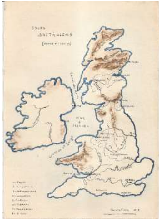
Ilustración 1. Geografía: Islas Británicas, acuarela.