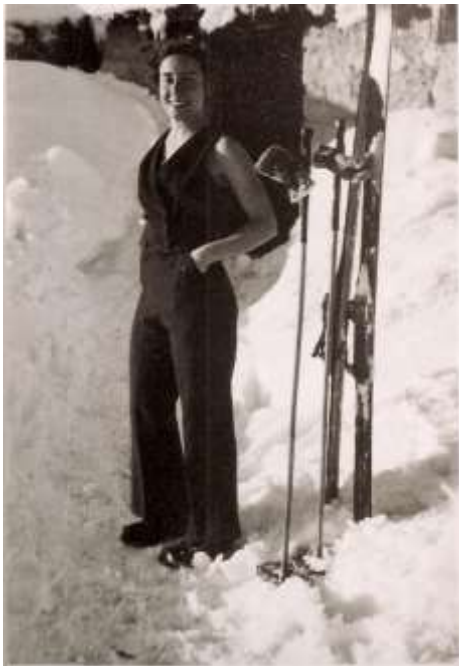
Ilustración 6. Practicando esquí (Sierra de Guadarrama).