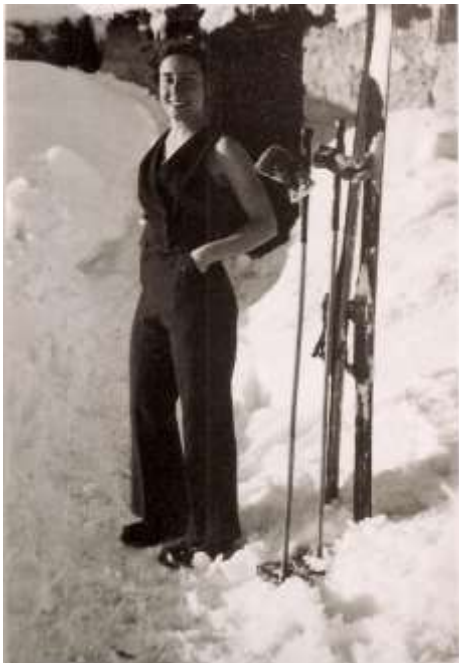
Ilustración 6. Practicando esquí (Sierra de Guadarrama).