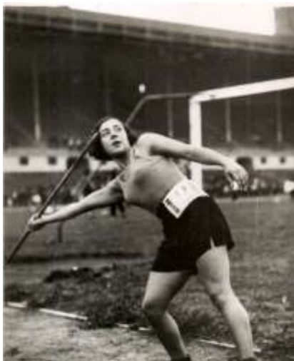
Ilustración 8. Lanzamiento de jabalina, II Campeonatos Nacionales de Atletismo, estadio de Montjuïc, Barcelona 1932.