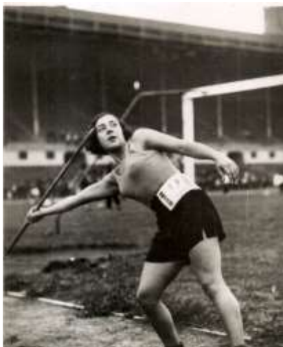
Ilustración 8. Lanzamiento de jabalina, II Campeonatos Nacionales de Atletismo, estadio de Montjuïc, Barcelona 1932.