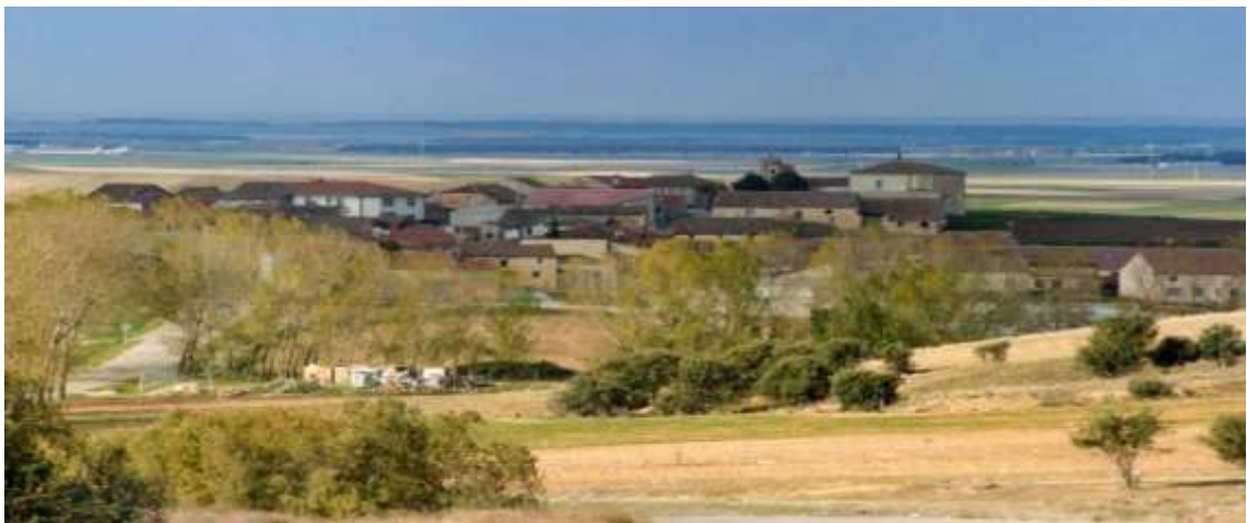
(Vista panorámica de Otones)

Educational heritage; pedagogical museums; eschool ethnography; school material history; educación history; rural development.